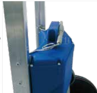
배터리 고정고리 배터리 빠짐 방지 고리