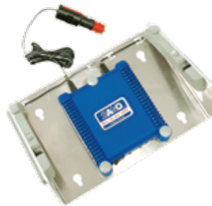
차량용 충전기 + 홀더