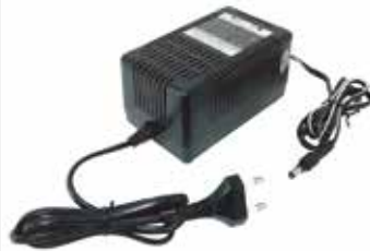
충전기 AC 220V