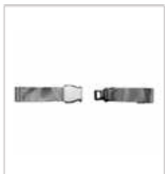
안전벨트 품번 075 105