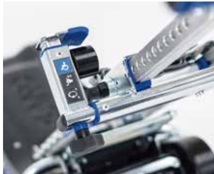
조절 가능한 휠체어 장착부