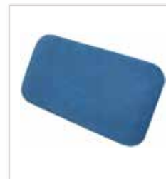
쿠션 등받이 품번 975 104