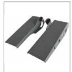
경사판 품번 975 103