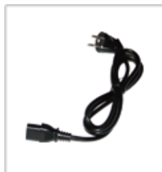
충전기 품번 075 637